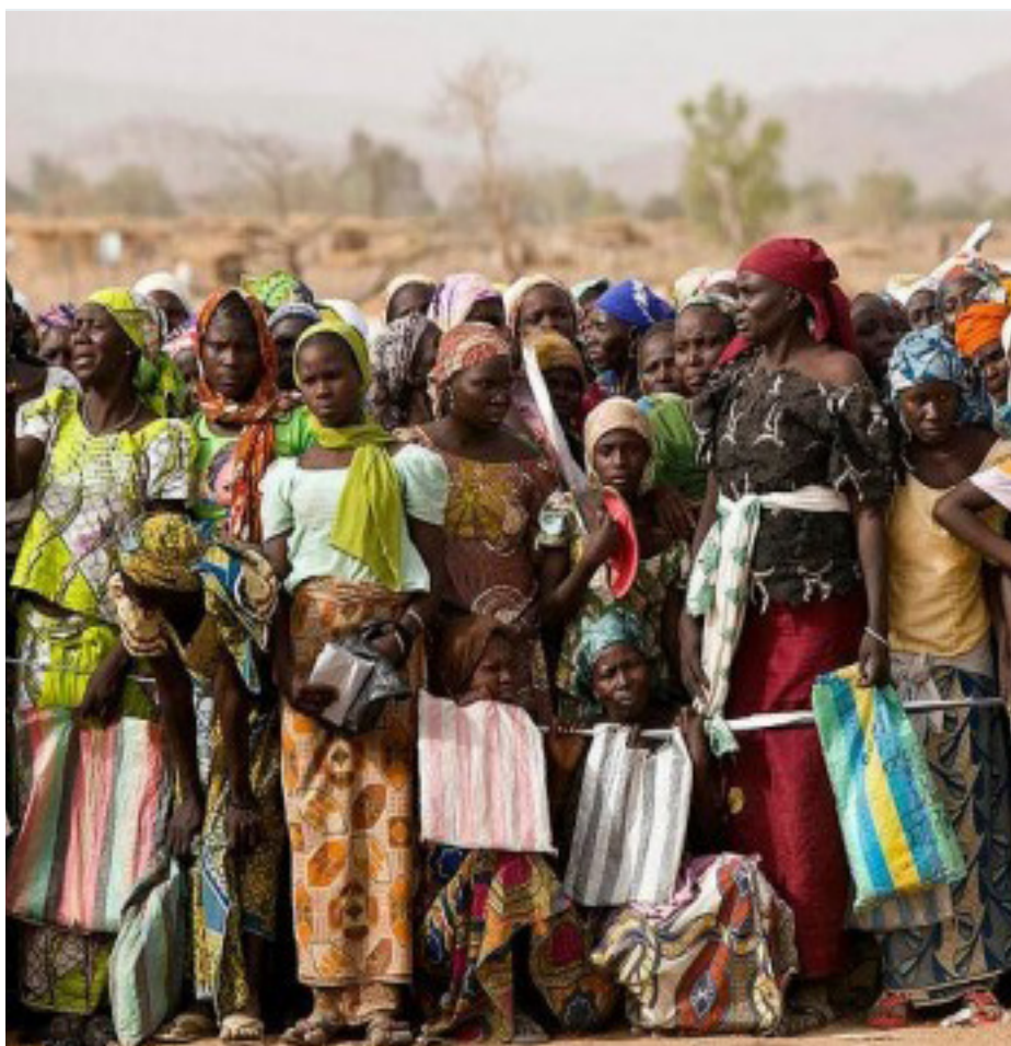
Nigerian people displaced by fighting in Nigeria find refuge in Cameroon

développement a atteint un point critique et les enjeux sont énormes et importants pour toute la région, a déclaré M. Dieye. L'analyse doit être large; elle doit inclure de multiples perspectives politiques, sécuritaires, religieuse, humanitaires et de développement.