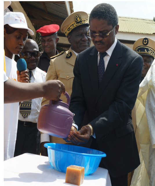
M Mama Fouda, Ministre de la Santé Publique se prêtant à l'exercice de lavage des mains avec le savon

La station de radio CRTV couvrant la Région du Sud du pays et la Radio Ebiyin Equato-Guinéenne ont transmis toute la journée des programmes sur la maladie à Virus Ebola, et particulièrement sur les méthodes de prévention de la maladie. Pour Germain Ntchama Oyono, Directeur de la radio, « les trois frontières doivent être préservées de ce virus. Les mêmes méthodes de prévention, les mêmes messages et les mêmes changements de comportement doivent s'observer de part et d'autres de nos frontières ».