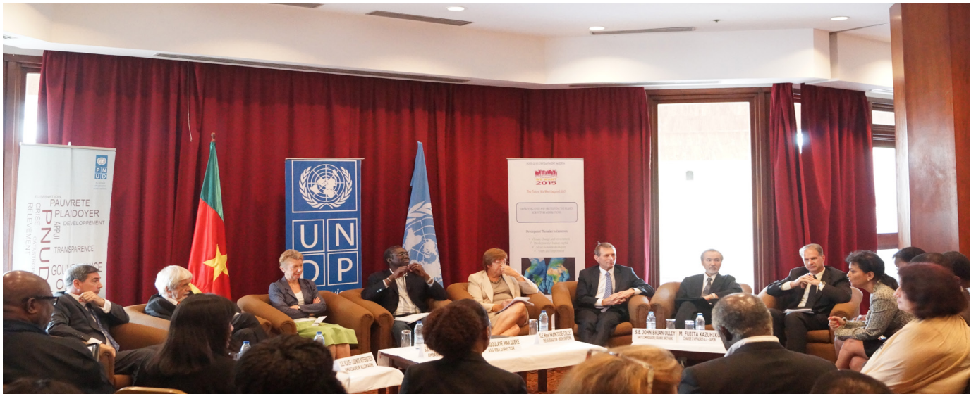
Session spéciale avec les Chefs de mission diplomatiques des pays donateurs (Allemagne, Canada, France, Grande Bretagne, Japon, Suisse, Union européenne, )